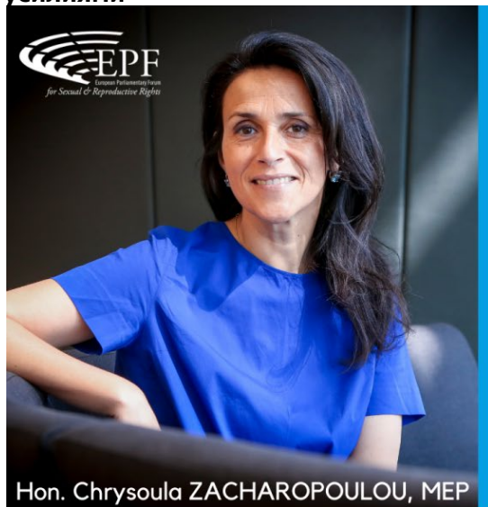
Hon. Chrysoula ZACHAROPOULOU, MEP